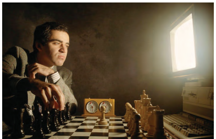
Am 10. Februar 1996 wurde die Überlegenheit des Menschen beim Schachspiel vom Computer beendet. Wo stehen wir 2018?

https://www.digitaltrends.com/computing/best-man-vs-machine-moments/ vom 17.6.2018